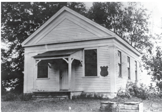
Kanisa dogo (kulia) la William Miller.