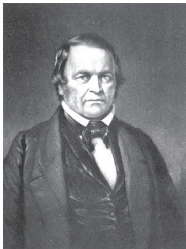
William Miller (kushoto) alisaidia kuzindua Vuguvugu kuu la kurudi kwa Yesu katika nusu ya kwanza ya karne ya kumi na tisa.